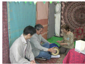
上: 会場でマリダンガムの個人指導