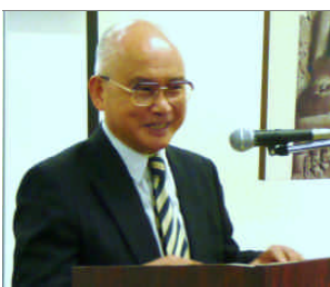
壇上で受賞の喜びを語る津田博士

【著書】『反密教学』（リプロボート・一九八六年／改訂新版・春秋社・二〇〇八年）、『空海』（中央公論社・一九九三年）、『金剛頂経』（東京美術・一九九五年）、『アーラヤ的世界とその神—仏教思想像の転回』（大蔵出版・一九九八年）等がある。